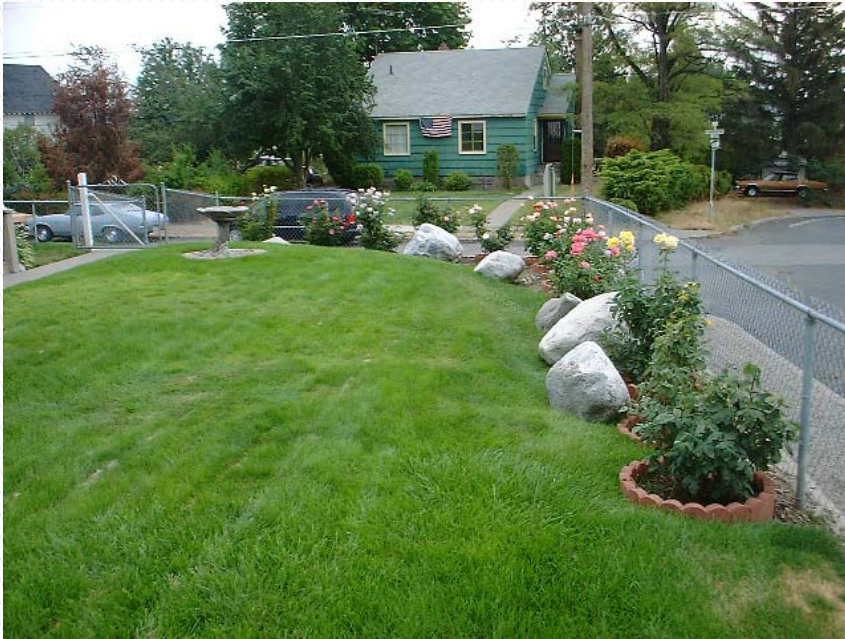
有主的房子 Managed House