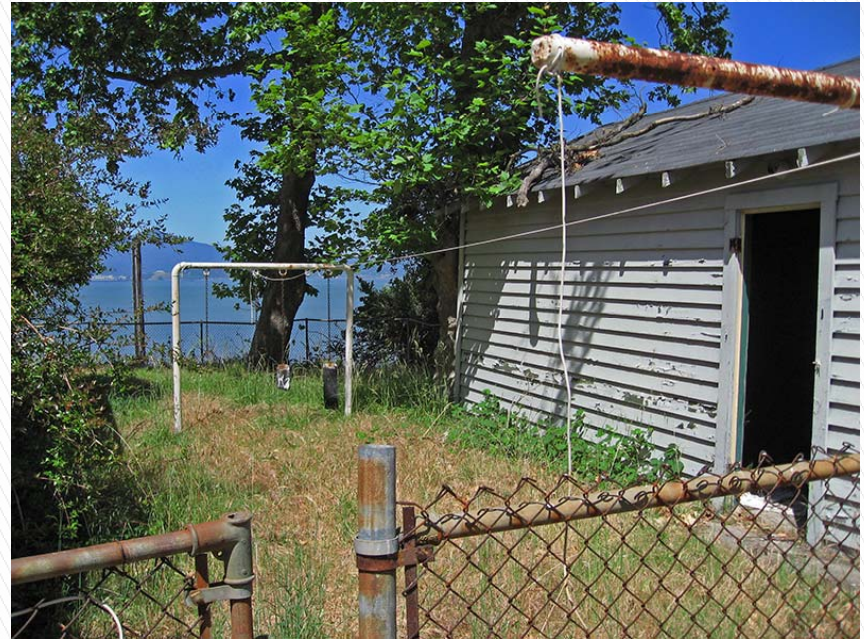
無主的房子 Abandoned House