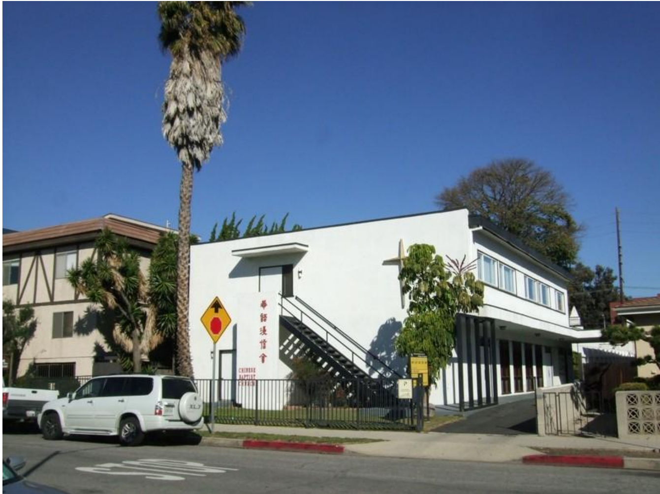
2/27/11 Warren Wang