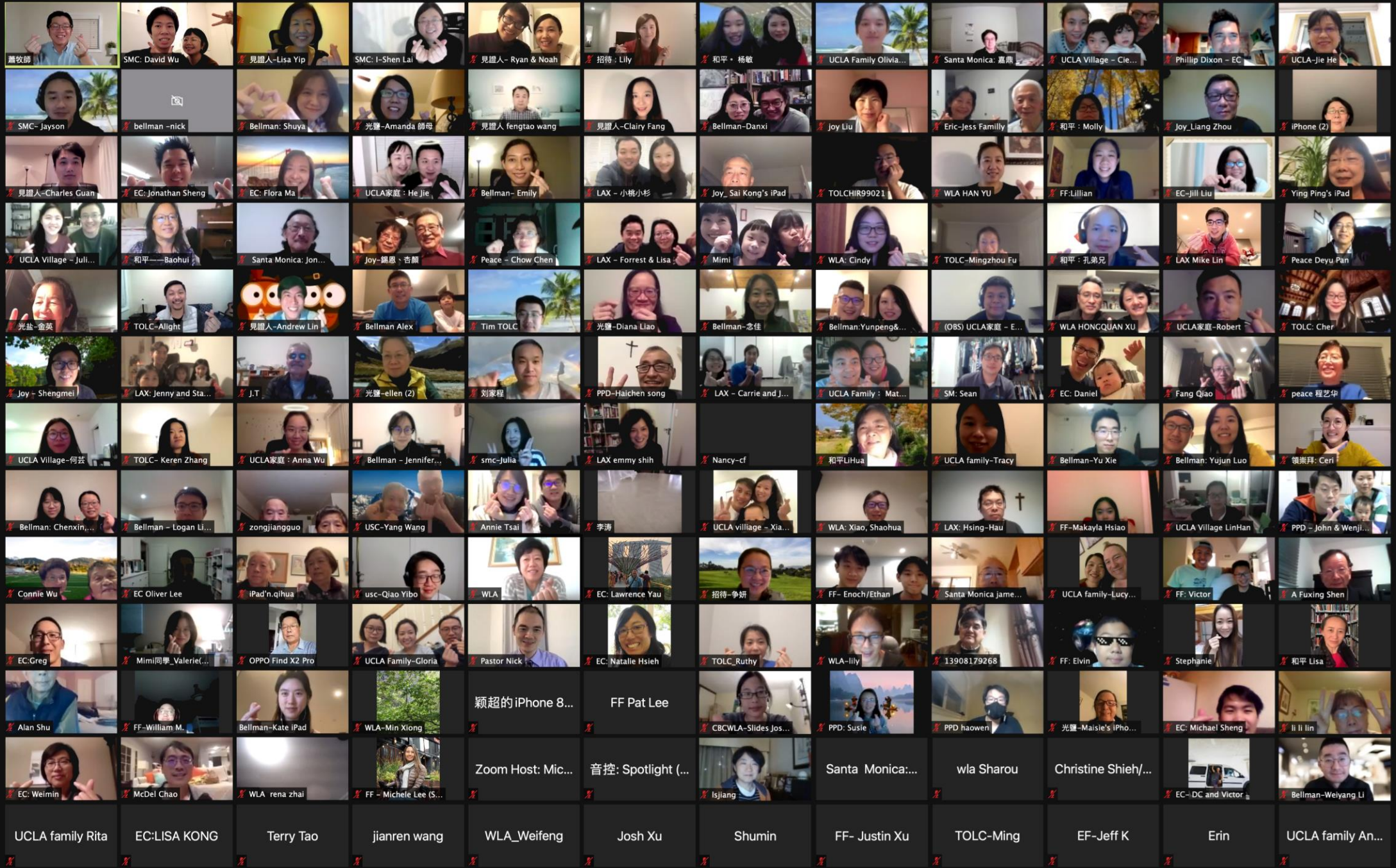
洛杉磯西區華語浸信會 感恩見證會 | 2020.11.21 | CBCWLA Baptist Church Thanksgiving Testimony Sharing