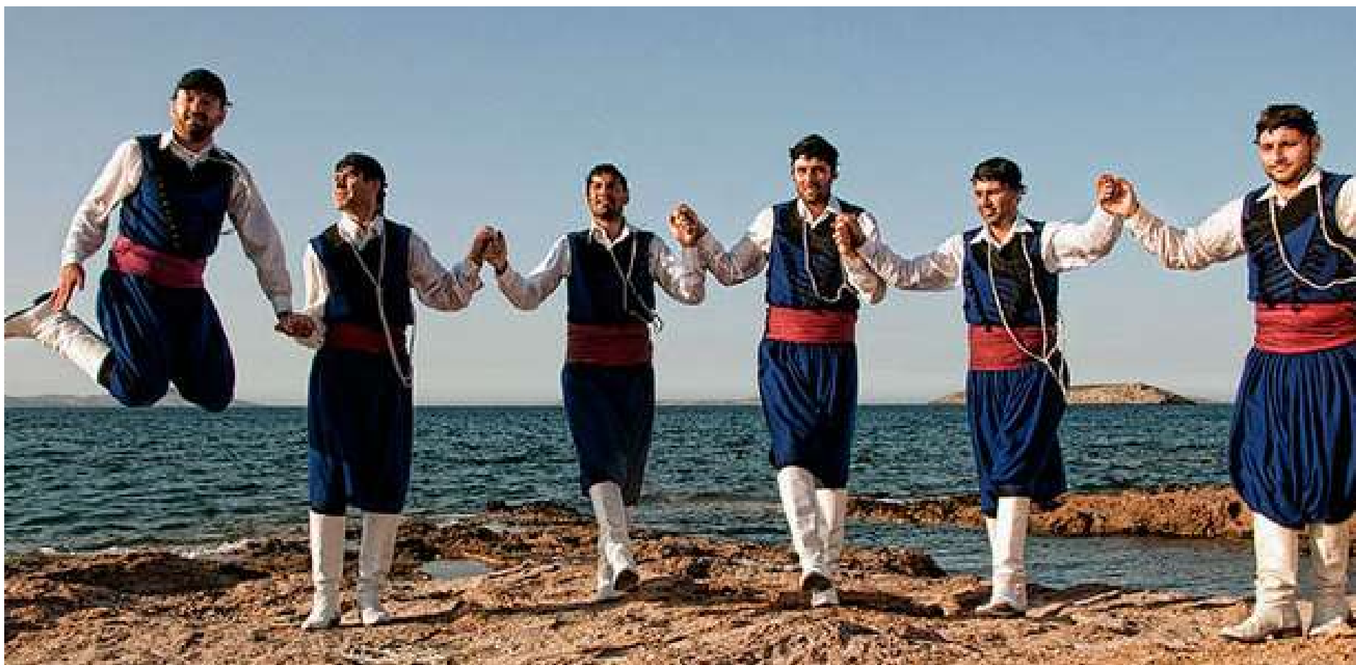
克里特人節慶，穿著當地的服飾