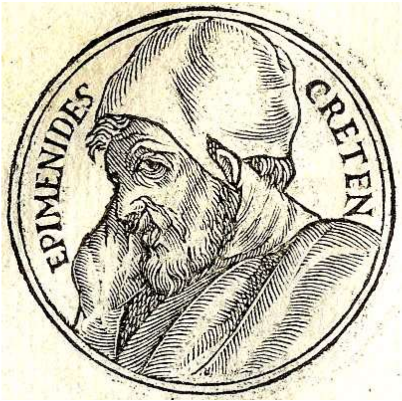
Epimenides，主前六世紀 革哩底人 Cretan