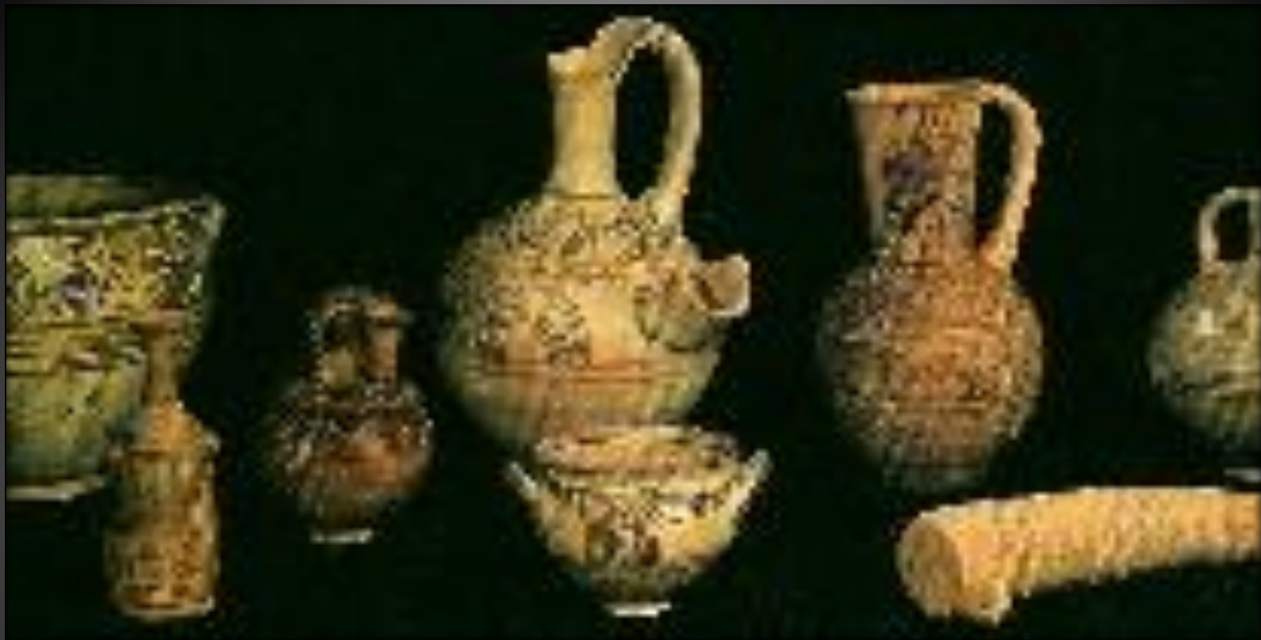
非利士人的文物：陶瓷器