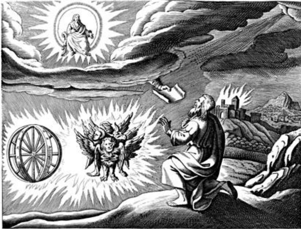
以西結看見異象 Matthaeus Merian (1593-1650)