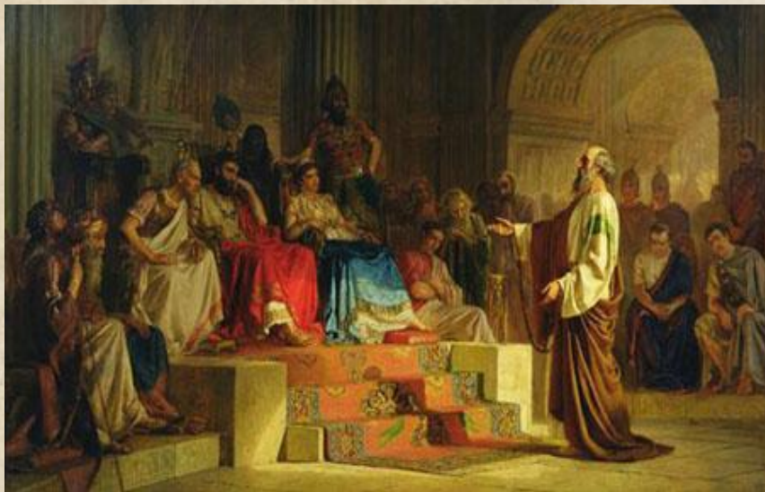
保羅在非斯都，亞基帕王，百尼基前受審