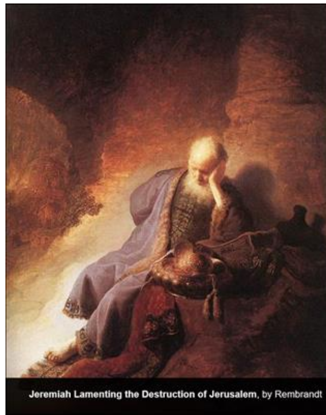
Jeremiah Lamenting the Destruction of Jerusalem, by Rembrandt