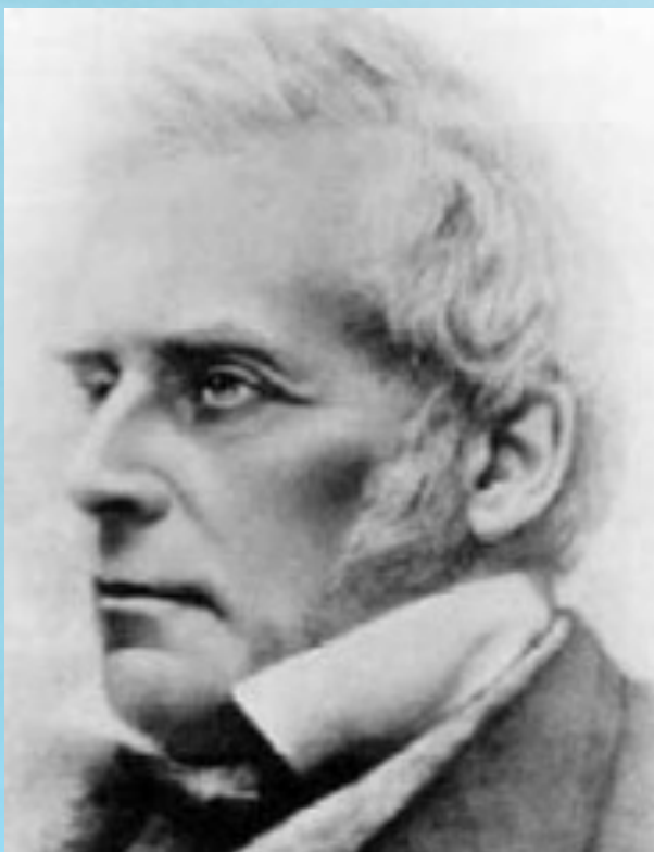
達密 1800-1882 John Nelson Darby

達密，英國傳道人， 時代主義 Dispensationalism 之父，普利茅 茲弟兄會Plymouth Brethren創始 人之一。中國的聚會所，又稱小 群，在創立之初受到普利茅茲弟 兄會和達密的影響，接受了時代 主義的神學理論，從這個角度來 解讀啟示錄和世界歷史。