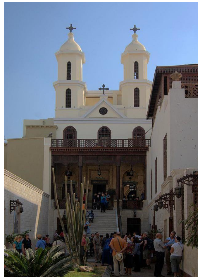
在開羅的 基督教堂