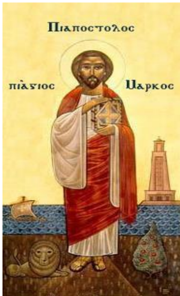
馬可將福音 傳至埃及